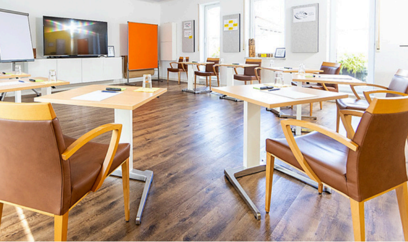
Seminarraum, 53 m 2 mit angeschlossener Terasse