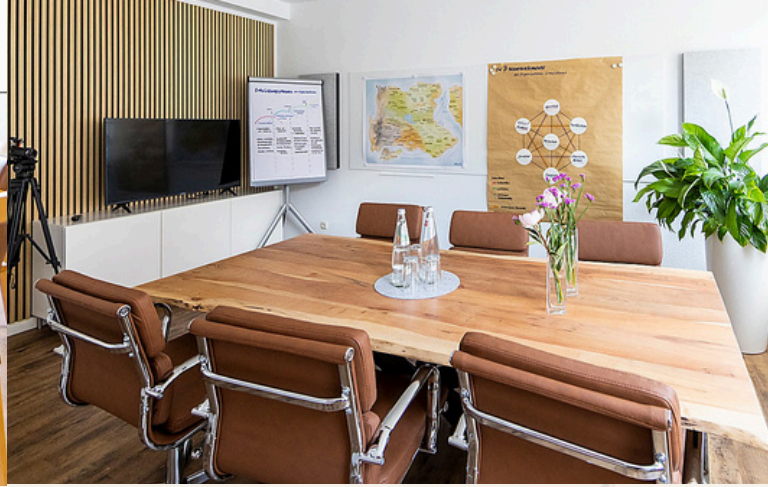
Meetingraum, 19 m 2

i Unsere Räumlichkeiten stehen für Veranstaltungen und Anmietung zur Verfügung.